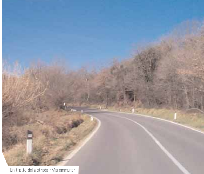
Un tratto della strada "Maremmana"

I lavori in corso nel 2006 e quelli in fase di progettazione sono finalizzati, essenzialmente, alla maggiore sicurezza. Infatti, il programma è stato fatto sulla base di un'analisi dei flussi di traffico, dei punti più pericolosi e della quantità di incidenti. Per dare un'idea della pericolosità di alcuni tratti di strade, il numero di incidenti sulla viabilità provinciale che hanno causato vittime, dall'agosto del 2000 ad oggi, sono ben 417 con 89 morti e 743 feriti. Un tributo di sangue altissimo che peraltro non tiene conto, per la difficoltà della raccolta dei dati, dei decessi postumi conseguenti agli incidenti stessi. Le strade dove si registrano i numeri più allarmanti sono la provinciale delle "Collacchie" con 54 incidenti, che hanno provocato 17 morti e 99 feriti.