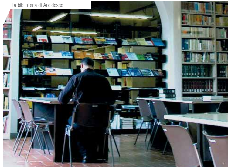
La biblioteca di Arcidosso

Riferimenti: Biblioteca Comunale di Arcidosso piazza Indipendenza, 30 58031 - Arcidosso tel. 0564/966438 fax. 0564/966010 biblioteca@amiata.net www.bibl.gol.grosseto.it Responsabile: Carlo Goretti