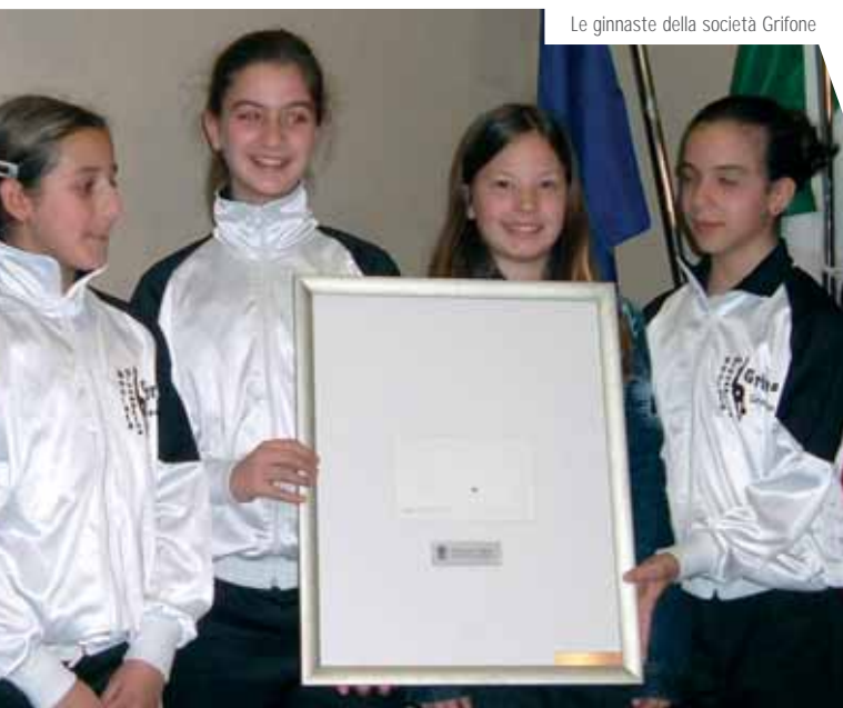
Le ginnaste della società Grifone