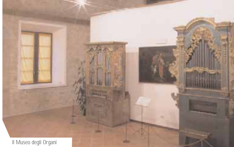
Il Museo degli Organi

Nel Museo Santa Cecilia sono custoditi 12 organi da chiesa. Tra questi i più importanti sono un raro esemplare di organo portativo di Carlo Traeri, del 1686, un organo positivo di Agostino Traeri del 1756, due strumenti del Seicento emiliano, un magnifico esemplare d'arte napoletana del 1742 di Domenico Magino e un imponente organo siciliano di Gaetano Platania, del 1771. Il Museo ospita anche 6 strumenti a tastiera che documentano l'evoluzione tecnologica, stilistica ed estetica del pianoforte: un clavicembalo italiano a due registri della seconda metà del 600, decorato con un dipinto a olio nella parte interna del coperchio; un fortepiano italiano a coda della fine del Diciottesimo secolo, simile a quello che utilizzava Mozart; un fortepiano "Daniel Dorr" dei