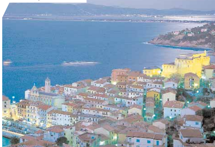
Una veduta di porto Santo Stefano

Per informazioni: tel 0564 462611 e-mail: info@lamaremma.info