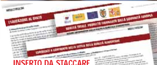
INSERTO DA STACCARE PROGETTO "QUALITÀ TOTALE"