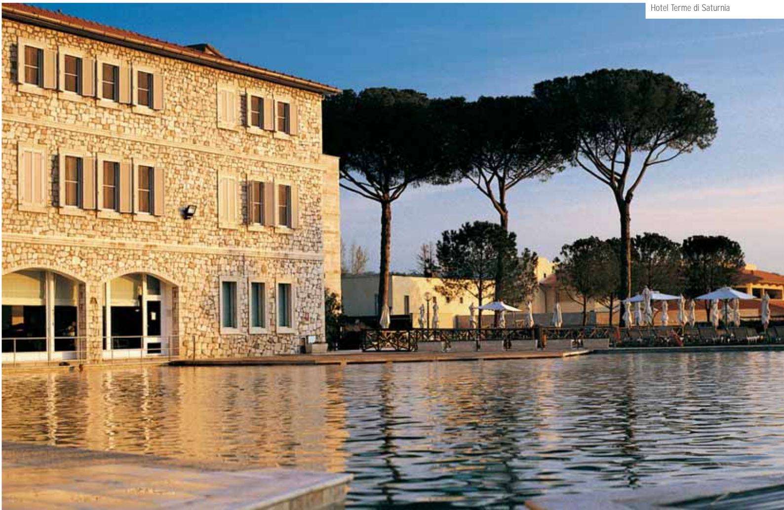
Hotel Terme di Saturnia

bocca, del fegato, per combattere le allergie e le intossicazioni, le malattie dell'apparato digerente, respiratorio, genitale femminile, muscolare e scheletrico, ma anche per malattie del ricambio, per riniti, sordità e obesità. Lo stabilimento termale pratica cure idropiniche, bagni, fanghi, inalazioni, nebulizzazioni, aerosol, massaggi semplici e subacquei, trattamenti fisiochinesiterapici. Quest'anno, inoltre, ricorre il cinquantesimo anniversario della nascita della società proprietaria delle Terme, il cui atto costitutivo risale al 28 aprile 1956. Nell'occasione è stata commissionata la stesura di un libro che ripercorre la storia antica e recente di Saturnia e per luglio 2006 è stata messa in calendario una vera e propria festa per celebrare la ricorrenza.