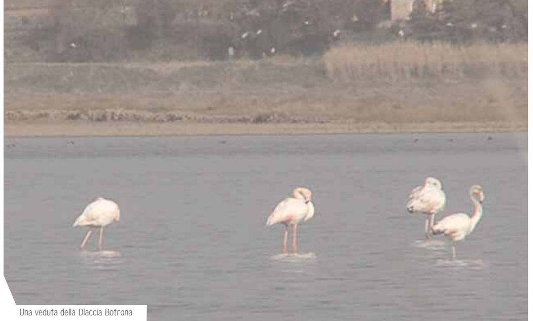
Una veduta della Diaccia Botrona

ambientale contribuisce alla valorizzazione e alla promozione del territorio, essendo uno strumento di facile consultazione per i turisti. Ma le sue applicazioni sono innumerevoli: dall'acquisizione di immagini a scopo didattico, per la ricerca e la sperimentazione, lo studio e il censimento della fauna selvatica, al controllo e alla tutela dell'ambiente. Un progetto d'avanguardia che consente alla Provincia di supervisionare costantemente il territorio. Alla rete è infatti collegata la Sala operativa della Protezione civile che, insieme al totem di Palazzo Aldobrandeschi, ha la priorità nel comando delle telecamere rispetto alle postazioni multimediali delle Riserve provinciali. La rete funziona come strumento di prevenzione, sia per gli incendi durante la stagione estiva, che per gli eventi calamitosi in altri periodi dell'anno, grazie al monitoraggio costante del livello delle acque dei principali fiumi. Per fare qualche esempio: la telecamera sul Monte Aquilaia consente il controllo di tutto il versante ovest del Monte Amiata e della pianura fino a